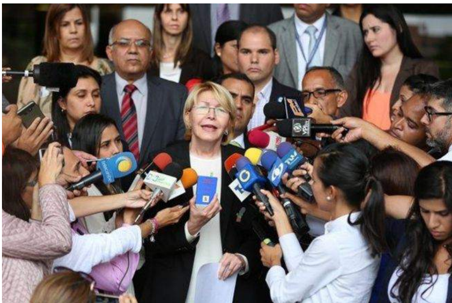
Luisa Ortega Diaz, la Fiscal General de la República (équivalent de Procureure générale de la République) en fonction de décembre 2007 à août 2017

Bien qu'il y ait exagération, et que même sans cette décision du 30 mars, on peut penser que la suite des événements allait quand même avoir lieu d'une façon ou d'une autre, force est de constater qu'au niveau juridique, la décision du TSJ est en effet discutable, et que c'est un cadeau pour l'opposition. (pour mieux comprendre ce qui s'est passé juridiquement, je vous renvoie dans les notes à la seconde partie de cet article 52 )