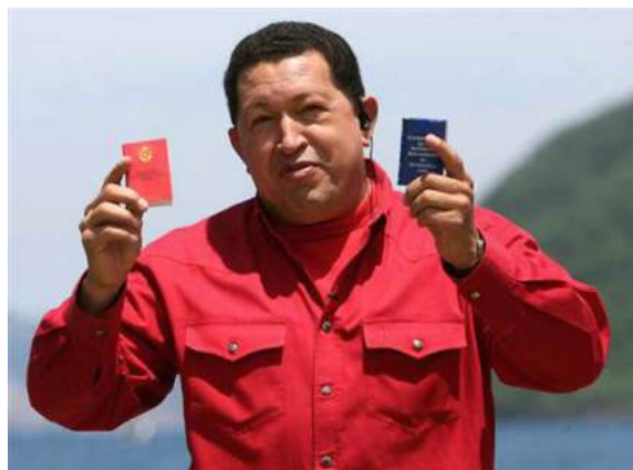
Chavez tenant la constitution de 1999 (droite) et la nouvelle (gauche) si la réforme constitutionnelle est approuvée

La réforme prévoit également d'abolir la limitation du nombre de mandats dans le temps et d'élargir à sept ans la durée d'un mandat présidentiel. Diantre! Il y a là la preuve évidente du caractère dictatorial de cet homme! Une campagne médiatique de grande ampleur est engagée pour dénoncer "l'autoritarisme" présumé de Chavez. Une hypocrisie d'une ampleur risible. Le projet en lui-même n'est pas imposé au pays. Il est d'abord soumis au vote de l'assemblée nationale puis à celui du peuple par référendum. L'opposition avait boycotté les législatives de 2005 et se plaint de ne pas pouvoir agir sur cette réforme. Drôle de situation non?