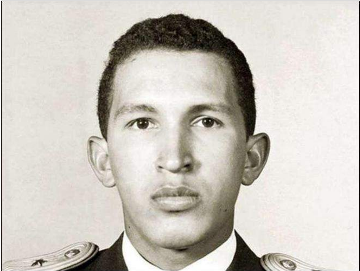
Hugo Chavez à l'académie militaire