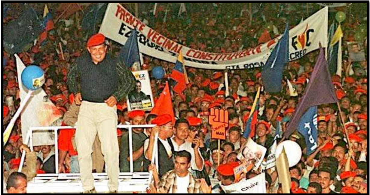
Hugo Chavez en décembre 1998, après avoir gagné les élections et célébrant sa victoire dans la rue

Après que Perez ait finalement quitté le pouvoir en 1993 pour fraude fiscale, en 1994 est élu l'indépendant Rafael Caldera, grâce entre autre à la promesse qu'il a faite de libérer Chavez s'il arrivait au pouvoir (Chavez étant devenu très populaire auprès de la population grâce à sa tentative de putsch). La promesse est tenue et Chavez est libéré. Il fonde alors le parti Mouvement Cinquième République avec lequel il se présente aux élections de 1998 avec la promesse de changer la constitution et de rendre sa dignité au peuple.