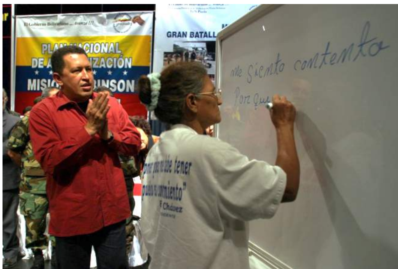
Hugo Chavez en 2003 lors d'une cérémonie de remise de diplômes dans le cadre de la mission d'alphabétisation Robinson

D'autres missions concernant l'éducation ont vu le jour avec chacune leur spécificités et particularités comme la mission Sucre ou la mission Ribas .