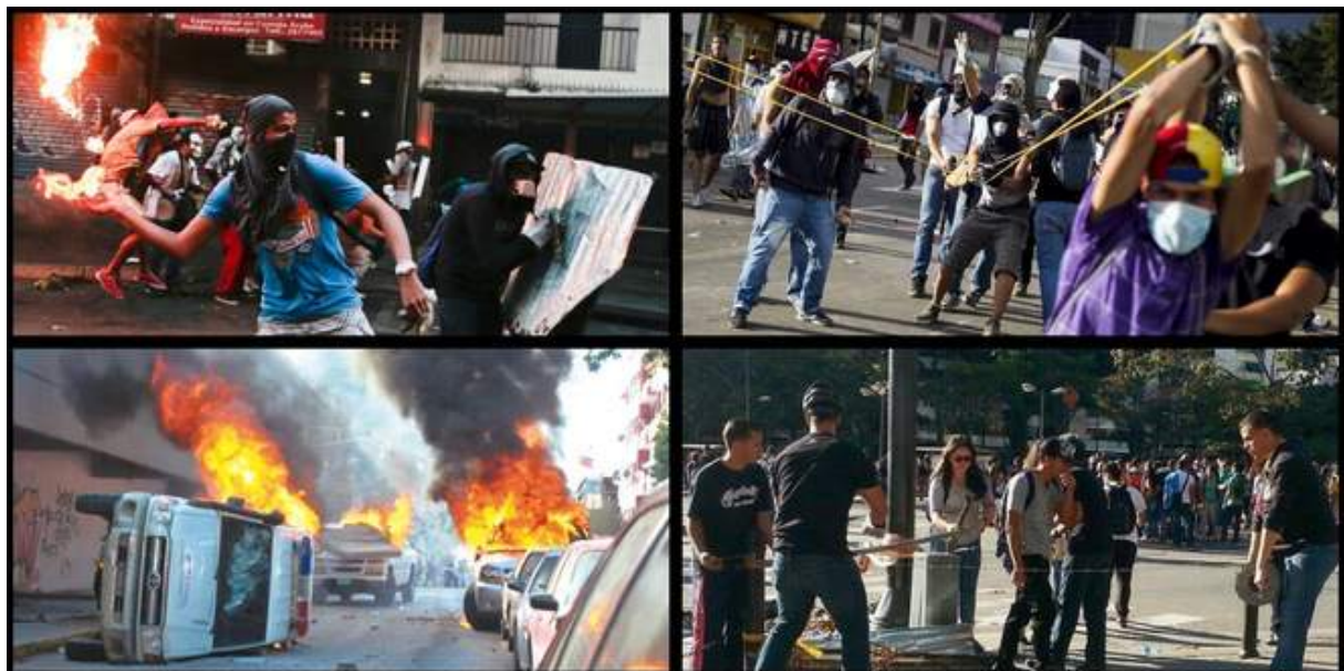
Quelques images des guarimbas de 2014 (je pourrais mettre "2017" on y verrait que du feu)

Le 12 février, Lopez lance ses sbires à l'assaut du ministère Public dans un discours enflammé. Sans mauvais jeu de mot, des cocktails Molotov sont lancés sur le ministère et des voitures de police incendiées. C'est le début d'une vague d'émeutes extrêmement violentes qui vont durer plusieurs semaines et qui sont connues sous le nom de guarimbas . Les pires méthodes y sont utilisées: des routes sont bloquées, des câbles métalliques sont tendus en travers de certaines avenues et des motocyclistes sont décapités, des partisans du gouvernement sont attaqués, des autobus, des ministères, des universités, des écoles, des centres de santé ou encore de distribution d'aliments sont incendiés 37 .