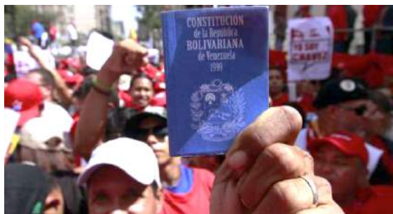
Un homme brandit la constitution de 1999 lors d'une mobilisation chaviste (photo non datée)

Après validation populaire par référendum le 15 décembre 1999, le 20 décembre la nouvelle constitution est adoptée.