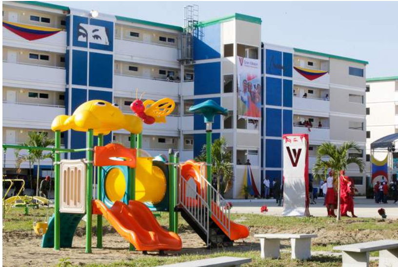
Inauguration de logements dans le cadre de la Gran Mision Vivienda en 2016

Il existe plus d'une vingtaine de missions actives au Venezuela. Je vous donne quelques chiffres significatifs qui illustrent bien leur impact sur la situation sociale du pays: