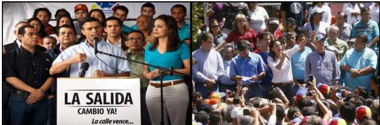
A gauche: Leopoldo Lopez et Maria Corina Machado annonce leur plan La Salida le 23 janvier 2014 | A droite: Lopez, Machado et Ledezma prononce leurs discours qui vont lancer les guarimbas le 12 février

l'opposition parmi lesquels Antonio Ledezma, Maria Corina Machado et un certain Leopoldo Lopez, appellent au chaos dans les rues pour organiser "la Sortie" de Maduro, autrement dit l'obliger à démissionner.