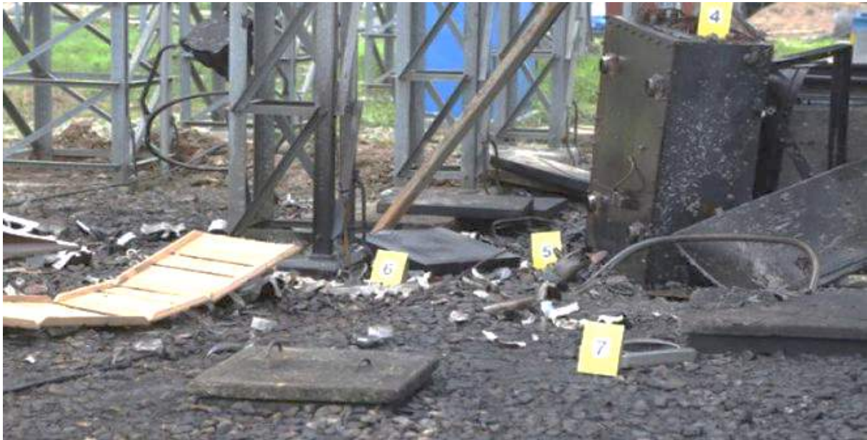
Sabotage d'installations électriques à Caracas, février 2016

Si sur les plans politiques et économiques, l'année 2016 fut éprouvante pour le Venezuela, il faut y ajouter également les catastrophes naturelles malheureusement. En effet, le pays a été frappé d'une très grave sécheresse durant les premiers six mois de l'année. La sécheresse a mis à mal les réserves d'eau du pays et l'approvisionnement en électricité, étant donné qu'il dépend principalement de centrales hydroélectriques. Inutile de vous dire que l'opposition a également surfé sur la catastrophe pour pointer du doigt le gouvernement. On constatera aussi que pendant cet épisode de sécheresse, des sabotages d'installations électriques ont pu être constatés.