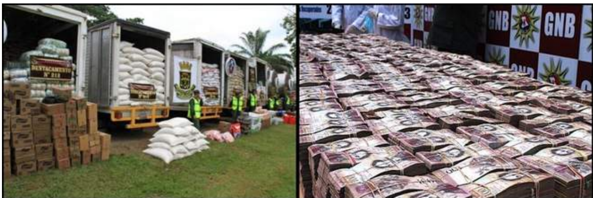
A gauche: En août 2015, 56 tonnes d'aliments sont saisies par l'armée à la frontière colombienne | A droite: En décembre 2016, 138 millions de bolivars sont interceptés à cette même frontière