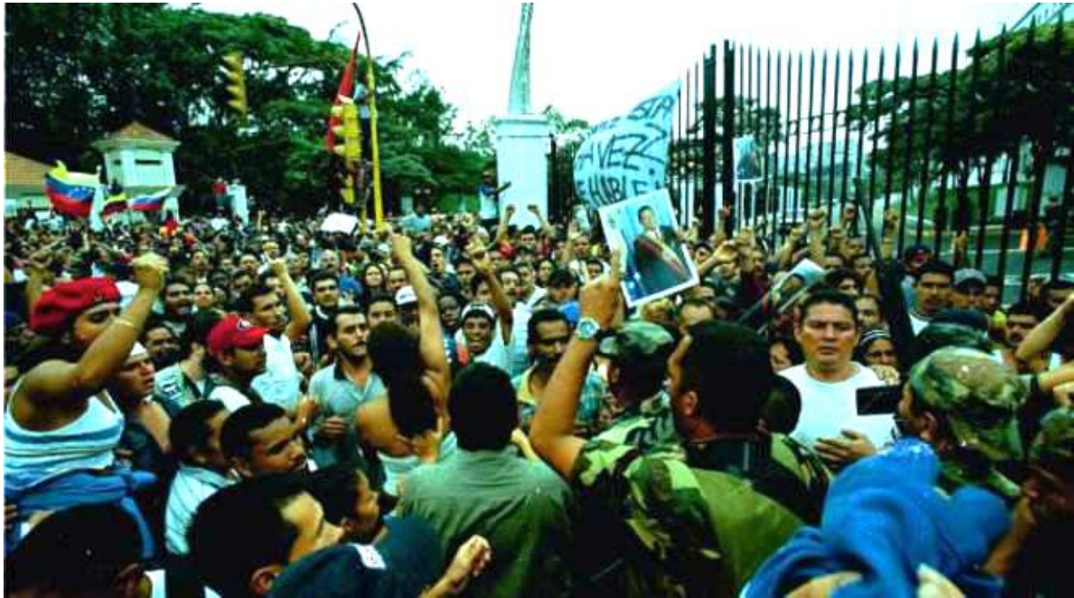
Le peuple devant le palais présidentiel exige la libération de Chavez

Ce coup d'état qui aura destitué Chavez durant 48 heures va renforcer considérablement sa réputation. Avant de passer à la suite, je voudrais vous donner une liste de noms que je vous sommes de retenir : Julio Borges, Leopoldo Lopez, Henrique Capriles, Maria Corina Machado, Antonio Ledezma, ou encore Globovision, Venevision, RCTV, Televen, El Nacional, Ultimas Noticias, El Universal, TalCual . Ce sont là des noms de personnalités politiques ou de médias qui ont soutenu le putsch contre un président démocratiquement élu et qui pour la plupart sont encore actifs aujourd'hui. Tachez de vous en souvenir. On reparlera de certains d'ailleurs dans le prochain article.