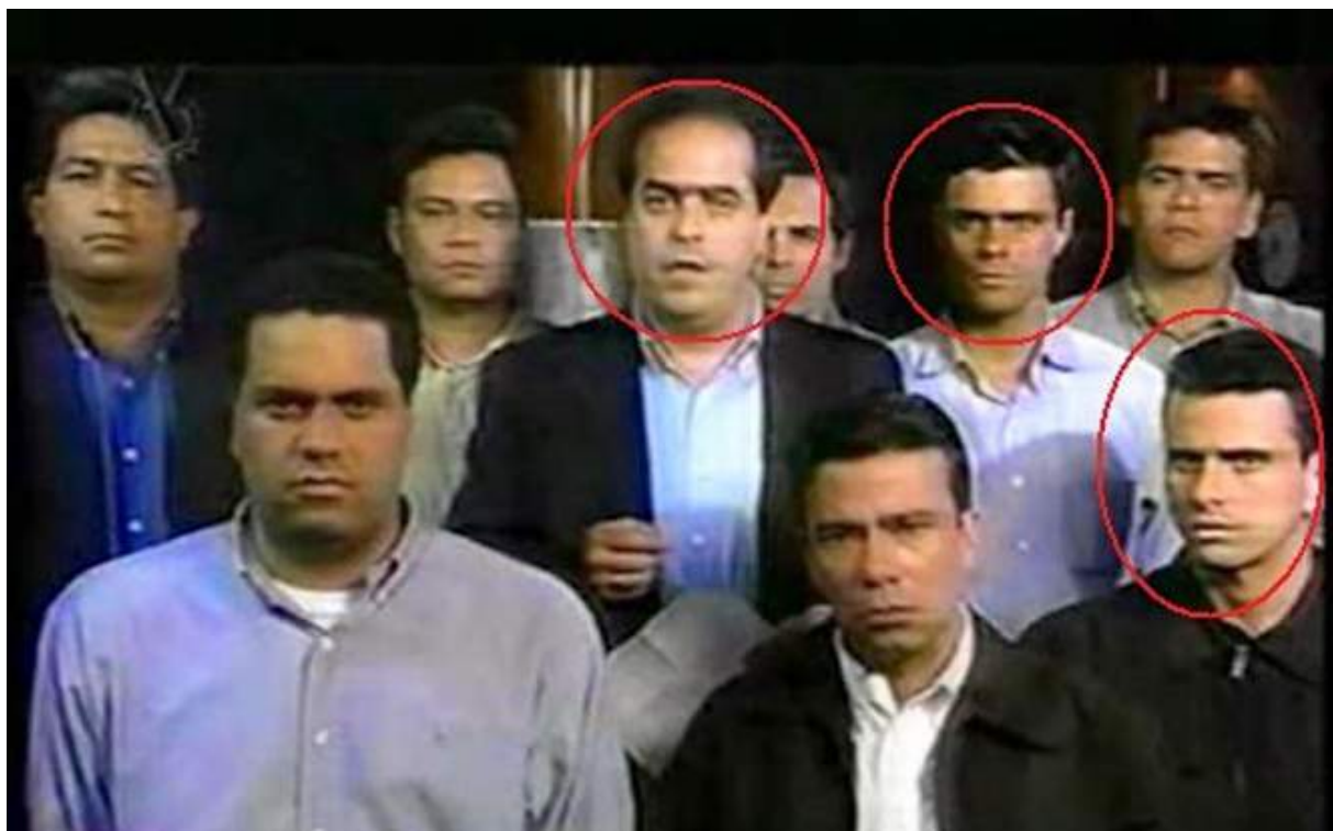
De gauche à droite: Julio Borges, Leopoldo Lopez et Henrique Capriles, lors de la lecture d'un manifeste soutenant le coup d'Etat contre Chavez en 2002