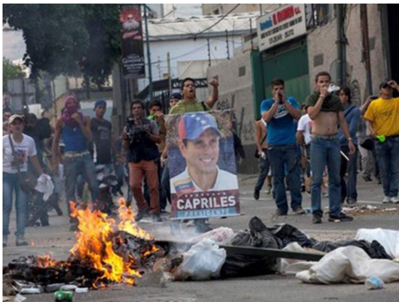
Groupes violents d'opposition brandissant le portrait de Capriles après l'élection de Maduro

L'écart de voix entre Maduro et Capriles s'élève à un peu plus de 220 000. Il n'en faut pas plus à Capriles pour dénoncer une fraude. Pourtant, 173 observateurs internationaux du scrutin parmi lesquels l'UNASUR ou le Mercosur notamment, ont reconnu la transparence du scrutin 36 . Le caractère démocratique et légitime de la présidence de Maduro est indéniable. A titre de comparaison, c'est comme si Mitterand face à Giscard en 1976, ou Romney face à Obama en 2012, n'acceptaient pas les résultats sous prétexte que les vainqueurs aient obtenu respectivement 50,81% et 51,07%. Lui-même, Capriles, a été réélu gouverneur de l'Etat de Miranda le 16 décembre 2012 avec 51,83% des voix. Mais l'opposition ne reconnaît pas le résultat. Malgré le re-comptage partiel des voix qui n'a présenté aucune anomalie, les hostilités sont lancées dans la rue. Les partisans de Capriles déchaînent leur haine: quatre sièges régionaux du PSUV sont incendiés, des centres médicaux pris d'assaut, des radios communautaires attaquées, pour un total de 7 morts et 61 blessés.