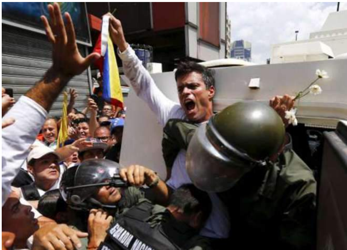
Leopoldo Lopez le 12 février lorsqu'il se rend, l'image fera le tour des médias

Le jour même du lancement des guarimbas le 12 février, il se rend aux forces armées. Certains expliquent son choix par la peur d'être assassiné par son propre camp pour en faire un martyr, ou l'écarter d'un certain leadership de l'opposition 39 . Il est jugé et condamné à 13 ans et 6 mois de prison pour les violences meurtrières qu'il a initié durant les guarimbas . Ça y est, l'opposition et la presse nationale et internationale ont leur martyr, représentant des "prisonniers politiques" au Venezuela.