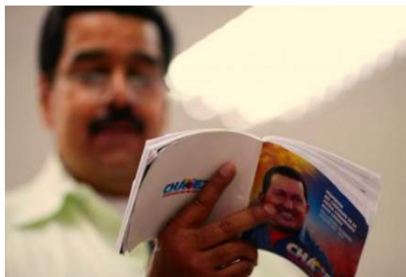
Nicolas Maduro lisant le Plan de la Patrie en 2013

Avant sa mort, Chavez laisse au chavisme et à Maduro un testament politique censé être une feuille de route pour le prochain mandat présidentiel: le Plan de la Patrie 34 . Tel Salvador Allende au début des années 1970, Chavez n'était pas dupe, il savait que son pays restait en majeure partie capitaliste et que la révolution n'avait fait qu'entamer une transition vers l'écosocialisme (on y reviendra dans le bilan du dernier épisode). Le Plan de la Patrie fixe cinq grands objectifs historiques afin d'accentuer cette transition: la défense de l'Indépendance Nationale, la continuation de la construction du socialisme bolivarien du XXI ème siècle, la création d'une zone de paix en Amérique, la contribution à un monde multipolaire, et le sauvetage de la vie humaine sur Terre.