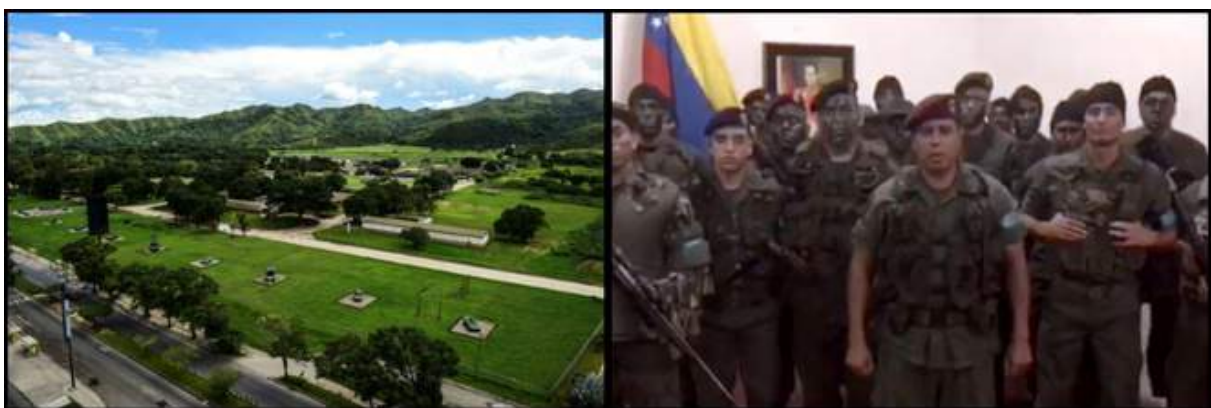
A gauche, une vue aérienne du fort Paramacay lors de l'attaque du 6 août | A droite, les mercenaires déguisés en militaires, appellent publiquement eux aussi à la rébellion

Même si ce qui va suivre a eu lieu peu après l'élection de l'ANC, je préfère le mentionner ici. Le 6 août, le fort militaire de Paramacay, à 180 kilomètres au Nord de Caracas, est attaqué. Des mercenaires déguisés en militaires prennent d'assaut le fort mais l'attaque est repoussée. Cette fois-ci, deux morts sont à déplorer, et huit assaillants sont arrêtés. Une vidéo circule de ces mercenaires se faisant passer pour des militaires, dans laquelle ils appellent à la rébellion.