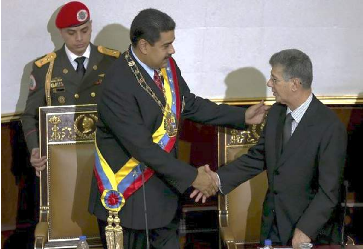
Le président Nicolas Maduro (à gauche) et le nouveau président de l'Assemblée Nationale Henry Ramos Allup (à droite), le 15 janvier 2016

Jacques Chirac? C'est absurde, mais c'est dans la continuité du fait que l'opposition n'a en réalité jamais accepté le chavisme, et encore moins l'élection de Maduro. Par conséquent, quoi de plus logique que de vouloir faire tomber un président dont on ne reconnaît pas le caractère démocratique de l'élection?