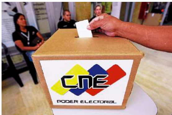
Vote lors de l'élection présidentielle de 2013

Après la liberté d'expression vient la démocratie. Je vais être concis, mais sachez que l'on n'a vraiment pas de leçons à donner sur ce sujet. Depuis l'accession au pouvoir de Chavez le 6 décembre 1998, dix-sept élections ont eu lieu au Venezuela 24 . Toutes ont été remportées par le chavisme à l'exception des législatives de 2015. A ces dix-sept élections s'ajoutent sept référendums nationaux, dont six remportés par le chavisme. La fiabilité de l'ensemble des scrutins a toujours été validée par l'ensemble des observateurs internationaux, et le Venezuela est reconnu dans la région comme ayant un excellent système électoral. En 2012, lors de la réélection de Chavez à la présidence, Jimmy Carter, 39 ème président des Etats-Unis, a même affirmé que le processus électoral vénézuélien était le "meilleur du monde" 25 . Un vrai marxiste-léniniste celui-là.